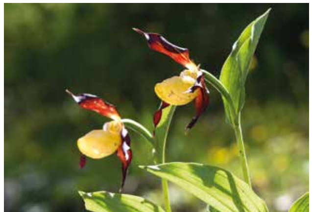
Cypridium calceolus -Trafoi 22.06.2012

Die 20 bis 80 cm hohe Astlose Graslilie ist eine ausdauernde, krautige Pflanze mit kurzem Wurzelstock. Am Stängel befinden sich 6 bis 10 kleine weiße Lilienblüten. Der Name Graslilie bezieht sich auf die grasartigen Laubblätter. In Planeil und Matsch überzieht sie im Juni die sonnseitigen trockenen Hänge mit einem weithin sichtbaren weißen Schleier.