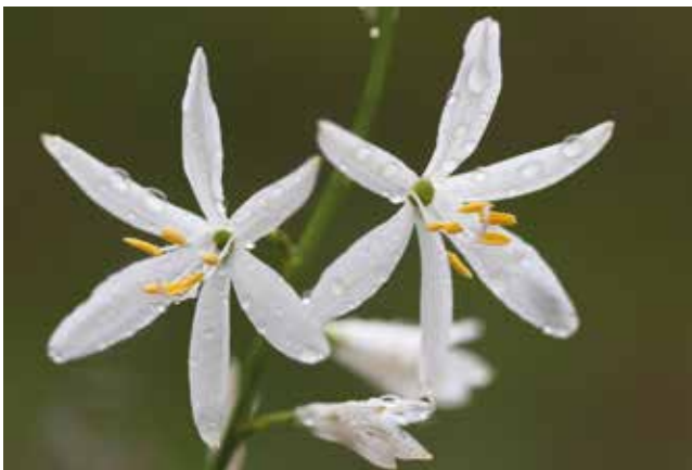
Anthericum liliago -Stilfs 13.06.2015

Der Frauenschuh ist die bekannteste heimische Orchidee. Ihre pantoffelförmige Unterlippe ist eine Kesselfalle, aus der hinein gelockte Kleininsekten nur herauskommen, wenn sie sich durch eine enge Öffnung hindurchzwängen und dabei ungewollt für die Bestäubung der Blüte sorgen. Den meisten Bergwanderern ist der Frauenschuh nur mehr von Bildern bekannt, da er durch Sammeln und Ausgraben äußerst selten geworden ist. Er steht unter strengem Naturschutz.