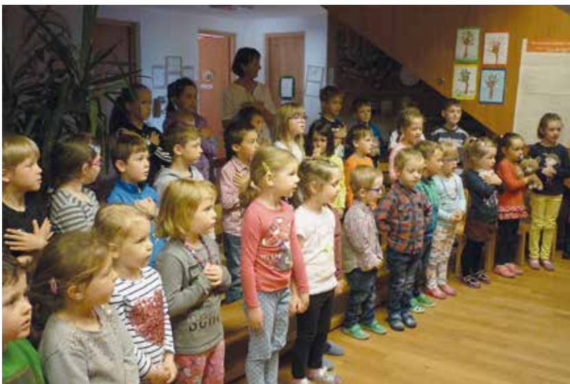
Kindergartenkinder und Schulkinder Laatsch

fen sich die Grundschüler von Burgeis und die Kinder der Kisi-Gruppe im Schulhof zu einem gemeinsamen Singen und Tanzen der Kisi-Lieder. Danach gestalteten die Kisi-Betreuer einen Workshop in Kleingruppen mit Impulsen zu Ostern. Ihre Freude und Begeisterung für Jesus übertrug sich auf alle Kinder, die aktiv mitmachten. Wir freuen uns, dass die Kisi-Gruppe aus Österreich unsere Gäste waren und uns durch ihre Freude und Begeisterung bereichert haben.