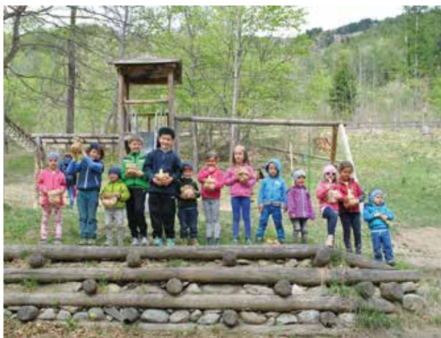
Ostereiersuche im Malser Park