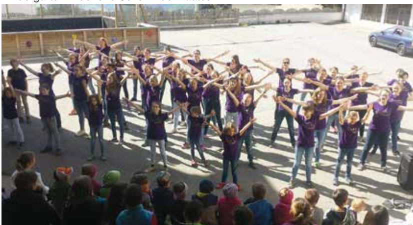
Singen und tanzen im Schulhof Burgeis