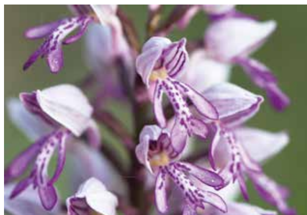
Orchis militaris-Prader Sand 22.05.2009