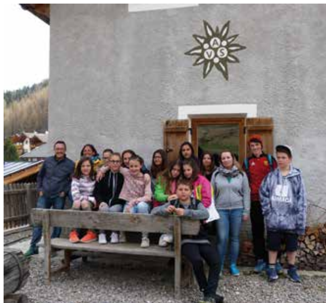
Hüttenlager in Pfelders im Passeiertal