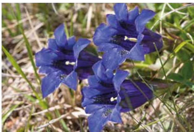
Gentiana acaulis-Matsch 23.05.2010 I