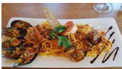
Höferalm mediterranes Nudelteller

ter- und Sommersportlern kunstvolle Teller. Die traditionelle Hausmannskost ist raffiniert und mit Liebe zum Detail auf den Tellern oder ‚Brettchen‘ angerichtet. So zeichnet sich die kleine Gourmetecke der Höfer Alm am Watles auch 2017 wieder durch Feingefühl und Kreativität aus.