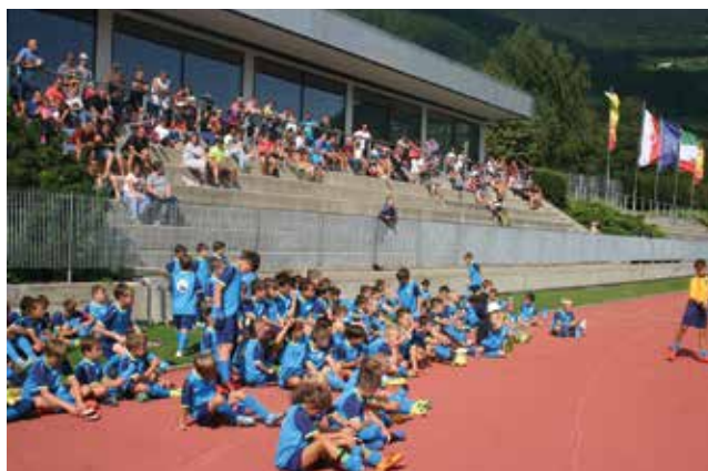
Teilnehmer und Publikum beim Hans Dorfner Camp 2017