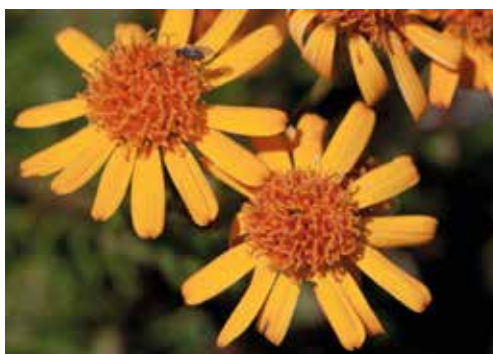
Nickende Ringdistel, Muntetschinig