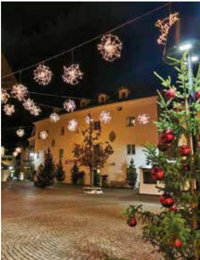
Weihnachtsstimmung in Mals