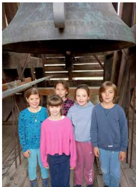
Im Turm der Pfarrkirche Laatsch

Am Samstag, 15. November, am Vorabend zum Caritassonntag, wurden in der Pfarrkirche von Laatsch fünf neue Ministrantinnen und Ministranten feierlich in ihren Dienst aufgenommen. Im Mittelpunkt der Liturgie stand das Thema Dienen, das Christus selbst vorgelebt hat und das auch für die jungen Ministrantinnen und Ministranten Leitmotiv ihres Engagements sein soll.